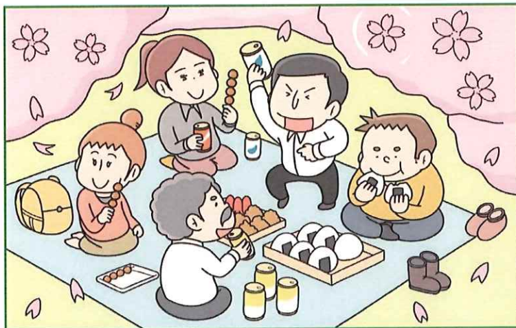
通所の皆様(食事風景)