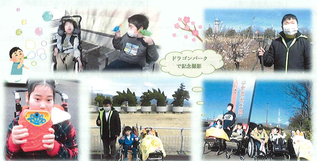
ドラゴンパーク で記念撮影

春は卒業の季節です。きらりでは今年3名の卒業生がいます。小学生のころからきらりに通っている子どもたちなのでさみしい気持ちもありますが、それぞれ新しい場所で楽しく過ごしてほしいと思います。